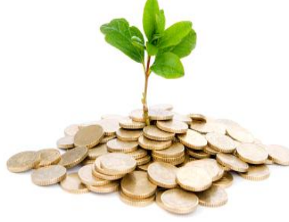
Reel Sektör Yatırım Çözümleri