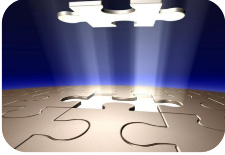
Yönetimsel Anahtar Teslim Çözümler